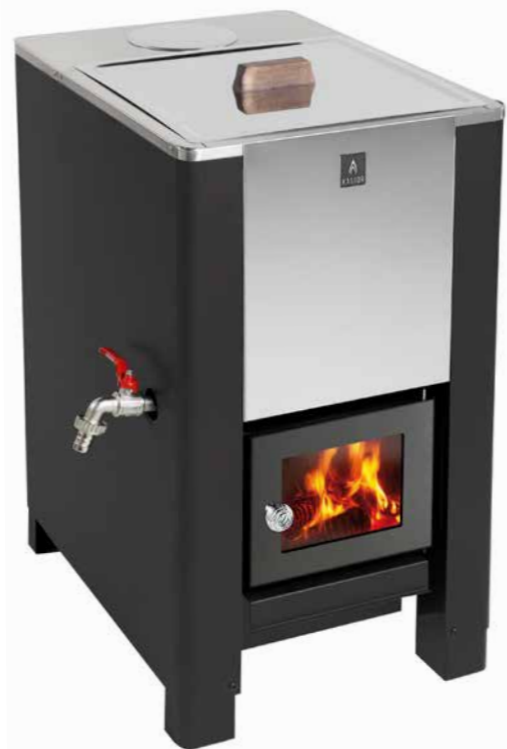
KASTOR KARHU PATA

Этот дровяной водонагреватель дополнит другие печи серии Karhu. Он построен на той же энергоэффективной платформе и интеллектуальных решениях, чтобы выделять как можно больше тепла за счет минимального количества дров.